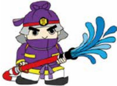
奈良県広域消防組合：まほろ隊長