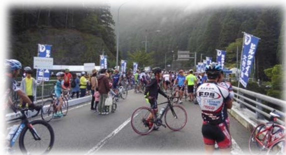
開会式前の清流橋

9月10日 (日) ヒルクライム 大台ヶ原第16回が開催されました。 約780名の選手が上北山村に集結しました!