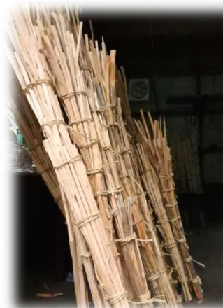
大人用、子ども用と長さはさまざま