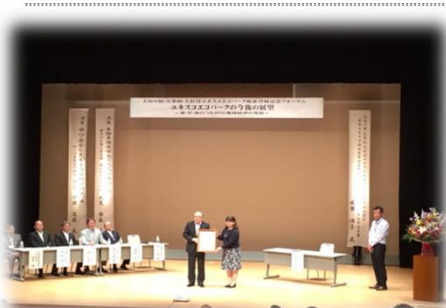
授与式のほかに講演も行われました