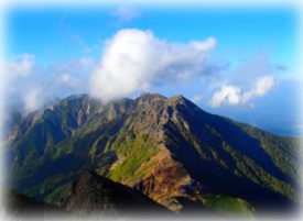
山頂から八ヶ岳連峰を望む

上北山村って山に囲まれていますよね。そんな土地に暮らしている皆さん、山を歩くことは好きですか？このコーナーでは上北山村の皆さんに新たな山の魅力を知ってもらうように、これまでに私が行った経験のある全国各地の山を紹介いたします。 第一回目に紹介する山は赤岳です。山梨県と長野県の県境に位置する八ヶ岳連峰最高峰の山です。標高は二八九九メートル。標高が高い、縦走ルートも楽しめる、小屋の数が多く、これらが人気の理由でしょう。私が登った際に泊まったのは岳頂上すぐ近くにある赤岳頂上山荘。天気が良いと日の入、星空、日の出、そして遠方には富士山！こんなにも絶景を楽しめる山旅はそうありません。ぜひ、足を運んでみては？