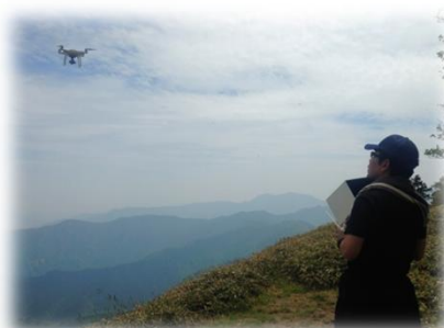
ドローン撮影の様子

これまでにもヒルクライム大台ヶ原、東大台、西大台、和佐又の映像が動画サイトにアップロードにあげられていましたが、この度、5月22日(日)に行われた第3回大台ヶ原マラソンでかみきたと春の大台ヶ原、村の隠れた名所の滝を宣伝する映像の撮影が行われ、その映像がビデオグラファーの松本敦さんにはドローンを使った空撮を得意