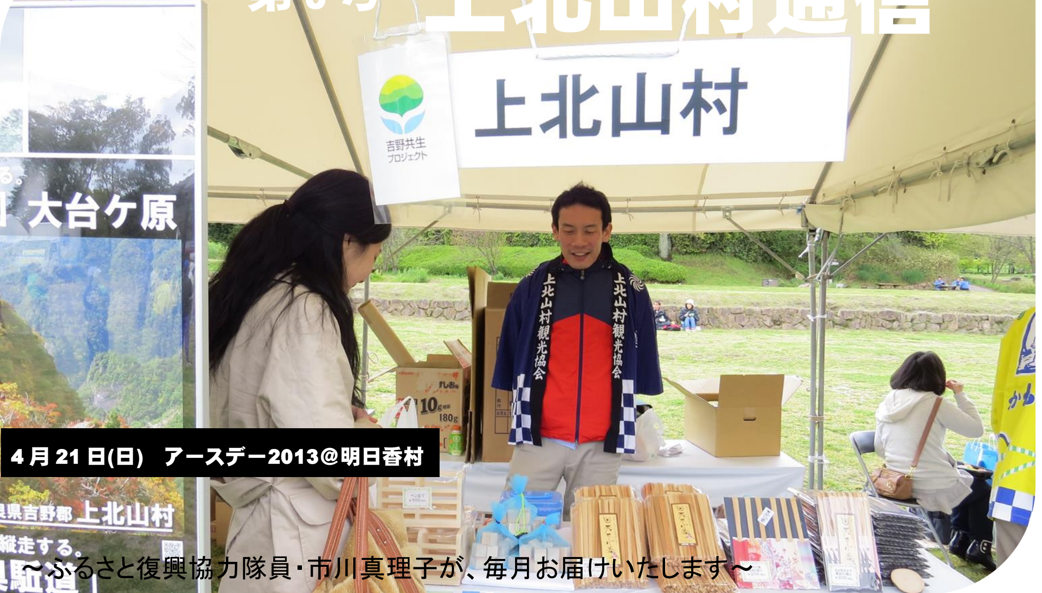
4月21日(日) アースデー2013@明日香村