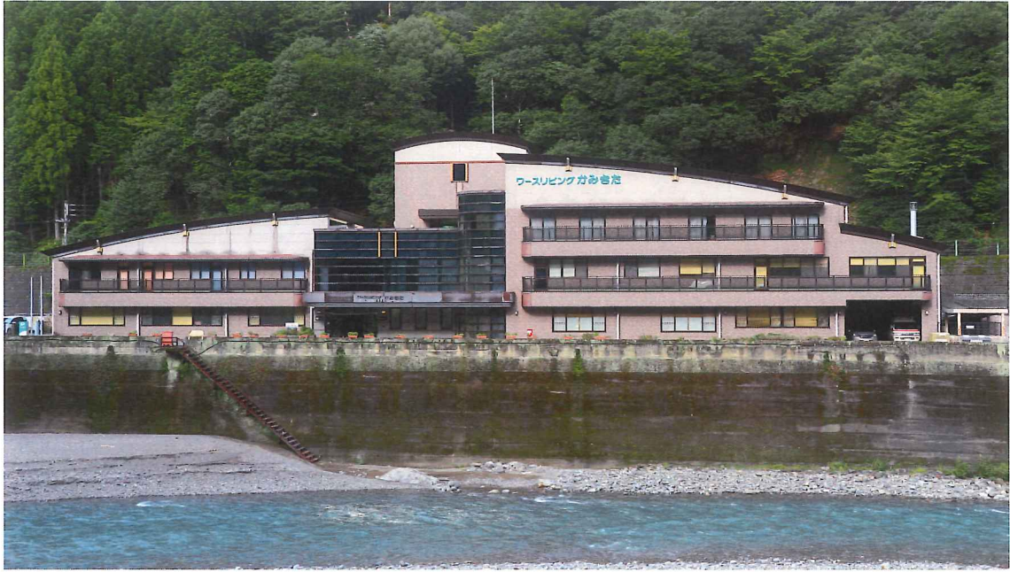
勤務先 ワースリビングかみきた 施設 外観 診療所 ・ 上北山村社会福祉協議会 ・ 村保健福祉課が入っています。