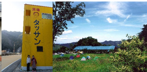
和佐又山ヒュッテ

※詳細は上北山村公式ホームページの最新情報からご覧になれます。 ※道路状況や天候等により、内容の変更または中止する場合があります。