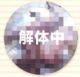
こんなシーンも! 命の大事さを学んで 命をいただきます。