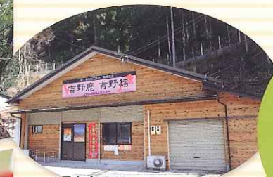
3月よりOPEN! 上北山特産加工センター